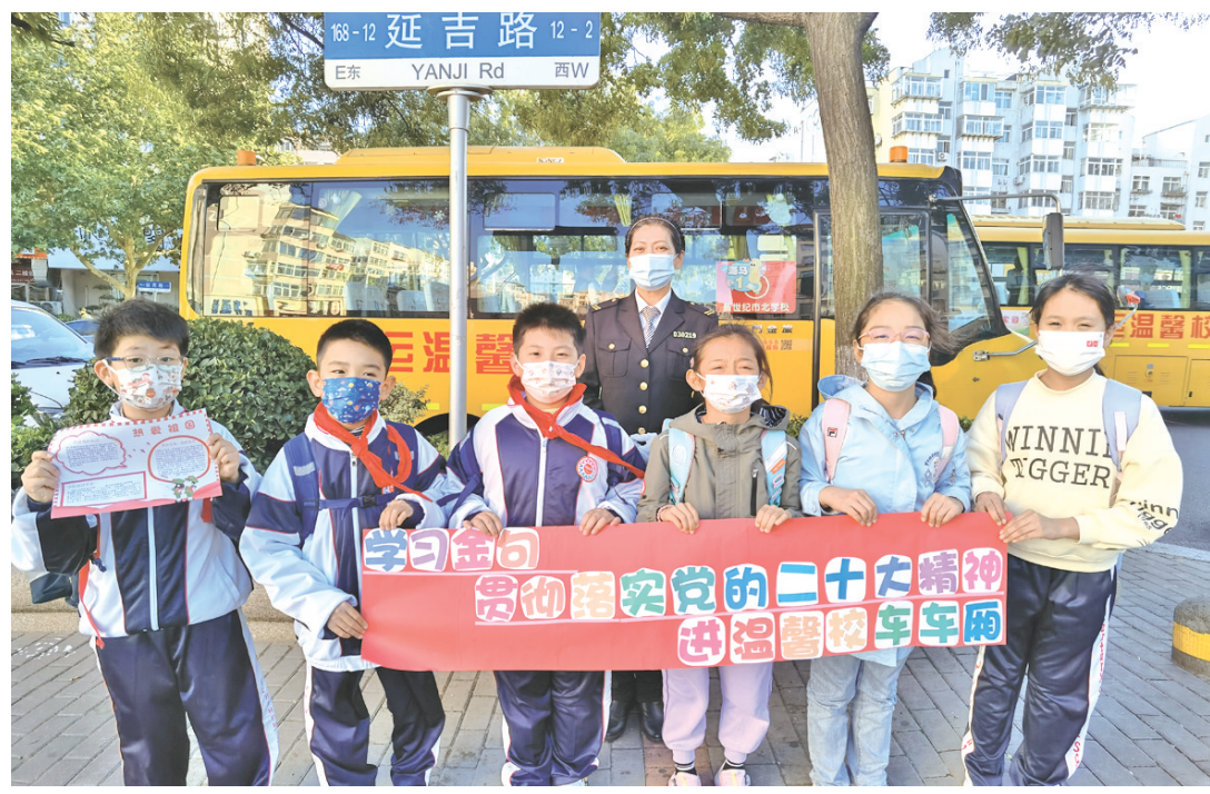
青岛城运控股集团推进学习贯彻党的二十大精神进校园。

“乘客满意只有终点,公交服务永无止境。我们将继续秉持服务至上理念,不断提升车厢服务品