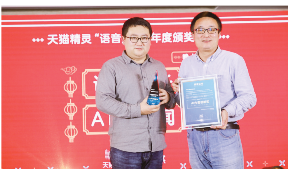
颁奖现场，青岛财经日报领取天猫精灵“语音头条”2019年度AI内容创新奖。

1月16日，天猫精灵“语音头条”年度颁奖在杭州举行。青岛财经日报获得天猫精灵“语音头条”2019年度AI内容创新奖。中国青年报、财新传媒、证券日报、第一财经、南方都市报、大河报等国内知名媒体获得该奖项。在同一天举行的天猫精灵“语音头条”媒体交流会上，阿里巴巴集团副总裁、天猫精灵事业部总经理库伟在致辞中对参加活动的国内合作媒体表示感谢，他表示，未来将加强与媒体合作。天猫精灵产品运营总经理杜海涛给来自国内的媒体介绍了天猫精灵业务发展，并对天猫精灵语音头条2020年度规划做了介绍。