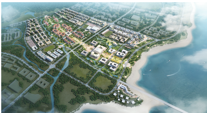
中国海洋大学西海岸校区鸟瞰图

青岛财经日报/青岛财经网讯(记者尹为鉴 实习记者陈敏娴)昨日,中国海洋大学海洋科教创新园区(西海岸校区)开工奠基仪式举行。